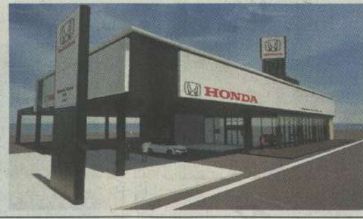
1月3日に開業する南陽店

ホンダカーズ東海(本社名古屋市中区)は来年1月3日、名古屋市中区に「ホンダカーズ東海 南陽店」を開業する。近隣の旧南陽店を移転して店舗面積を広げ、さらなる顧客拡大を図る。新店は、旧南陽店から数百メートル離れた、名古屋市中区知多1の208に新設する。地上2階建てで、敷地面積は約3千平方メートル、延べ床面積は約1900平方メートル。売り上げ規模は同社として中規模。1階にショールームや整備工場を設ける。車面展示台数は屋内に4台、屋外に6台。スポーツタイプ多